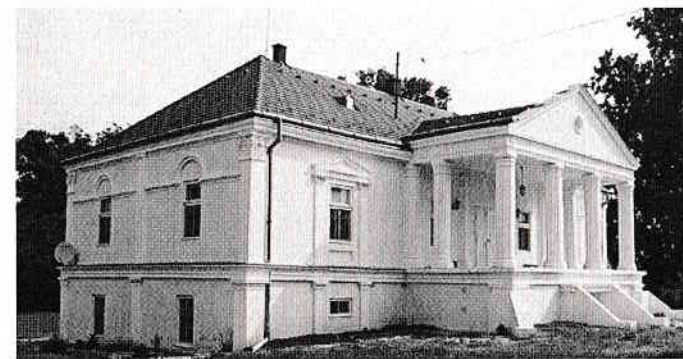
A szamosangyalosi Domahidy kúria