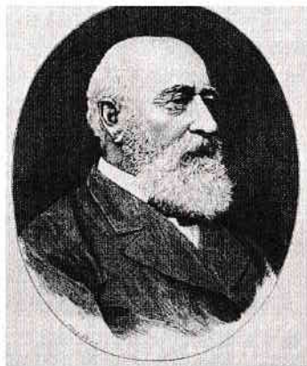
Gróf Teleki Sándor

De ha így van?... annál jobban Becsüllek.