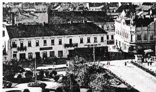
A berenczei Kováts-ház vendége volt Jókai Mór 1876-ban

Folytassuk a Jókai-látogatás történetével. Este 9 órakor a Lövölde (ma Kosuth-kert) helyiségében fogadást rendeztek a nagy író tiszteletére, és egy ezüst-serleggel lepték meg. A háromszáz terítékes vacsorán felköszöntők egész sora hangzott el. Jandrisics János (1837–1899), szentszéki ülnök, a Királyi Katolikus Gimnázium tanára, Jókainé Laborfalvi Rózára (1817–1886) mondta köszöntőjét. Páskuj Lajos (1825–1887) szatmári esperes-költő szózatát a mai napig megőrizték az érdekességeket szorgalmasan gyűjtögetők. A megsárgult papírszeleten piros ceruzával aláhúzták a Jókai művek címeit. Betuker Józsefné Szödényi Mária tanítónő gyűjteményéből jutott el hozzánk Páskuj Lajos pap-költő Jókai művek címeinek humoros felsorakoztatásával fűszerezett köszöntő: „Kívánjuk, hogy legyen: Egy